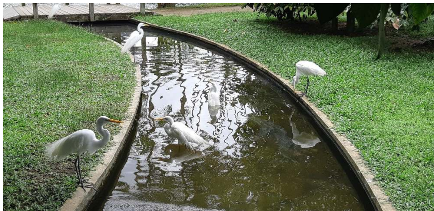
シラサギ公園、左は池の中にエイ。 右はシラサギ (Galça)。