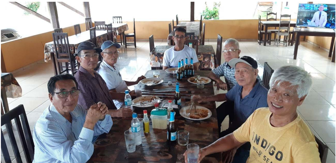
1月25日 アルサビアリア街道での昼食。