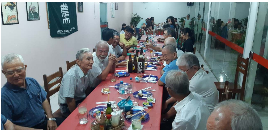
1月24日 トメアスー カリン食堂にて、地元の方々と共に懇親夕食会