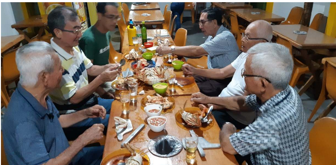
1月25日 ベレン市の Gatinho にて、泥ガニと河エビでの夕食。