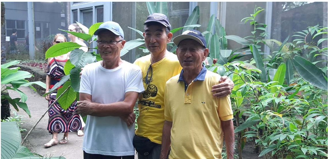
1月26日 ベレン市シラサギ公園にて