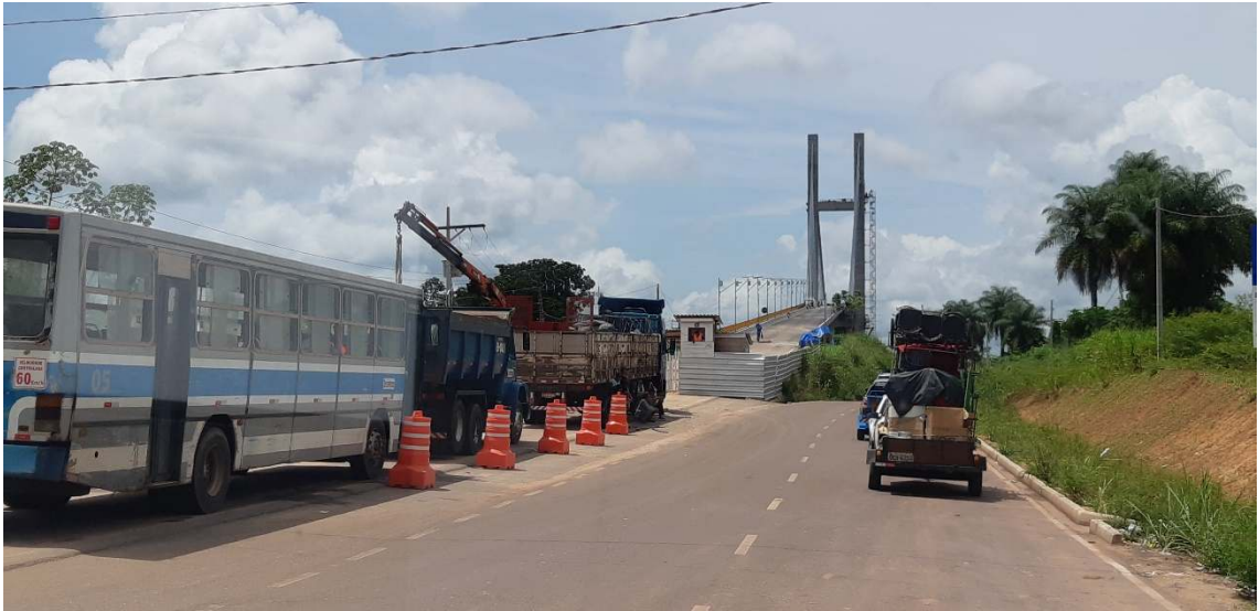
1月25日、モジューに掛かる第三の橋。2年前に決壊し修理完成間近。今月末に開通予定。