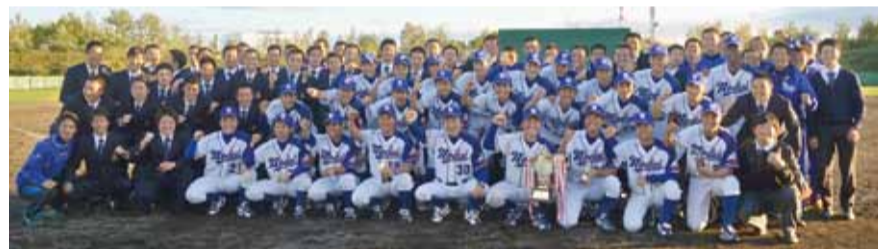
北海道六大学野球秋季リーグで優勝

陸上競技部強化指定部 第63回兵庫リレーカーニバル 2015日本グランプリシリーズ第3戦、第63回兵庫