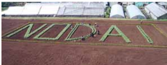
キャンパス内の圃場に作られたダイコンアート

厚木キャンパスのオープンキャンパスは、8月1、2日に開かれた。2日間で2686人が来場した。