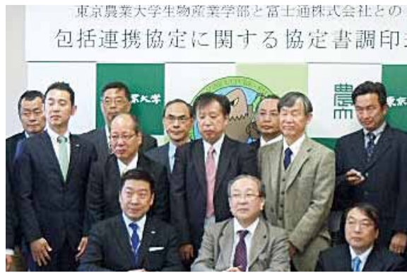
協定を締結した生物産業学部と富士通の関係者ら