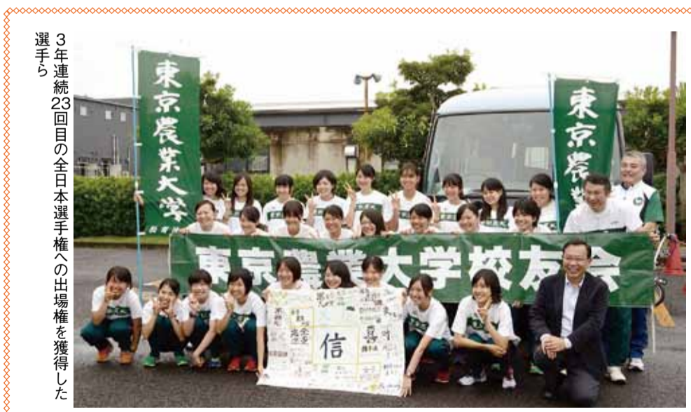
3年連続23回目の全日本選手権への出場権を獲得した選手ら