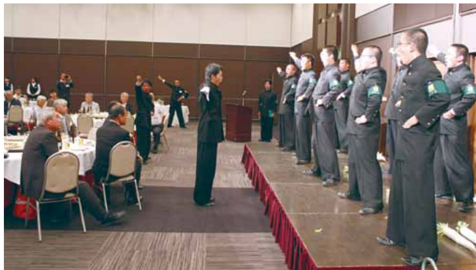
総会後の懇親会で学歌などを披露した全学応援団

団員30人は8月29日までの1週間、市内で合宿。この間、27日に市内繁華街のアリスガーデンでリーダー公開、道行く人々に農大をPRした。翌28日には、昨年の8月20日未明に発生した集中豪雨・洪水土砂災害により、多くの被害者を出した安佐南区にある市立梅林小学校を訪問した。早朝、団員一同は「広島土砂災害 忘れまい8・20」が刻まれた慰霊碑前に整列して黙とうを捧げ66人の犠牲者を弔った。その後、小学校の体育館に集められた梅林小学校の児童600人が見守る中、壇上でリーダー公開を行い、拍手喝采を受けた。児童を代表して6年生の女子が「東京農業大学全学応援団の皆さまにいた