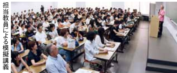
担当教員による模擬講義

主なプログラムは、各学科の担当教員による30分の模擬講義、食品加工技術などを体験する分野別模擬実習、一般入試の説明や推薦入試合格者の体験談が聞ける入試対策講座、各学科が学科のカラーを前面に出して来場者に学科紹介する「学科別ナビ体験」など。中でも学科別ナビ体験では、各学科とも昨年よりもさらに内容を向上させた。展示だけではなく、実際に体験をしながら学科の理解を深めることができる企画になった。来場した受験生は、