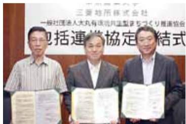
包括的連携協定を締結した三者