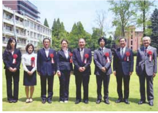
特別表彰された親子3代卒業生ら