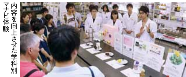
内容を向上させた学科別ナビ体験