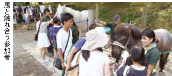
馬と触れ合う参加者