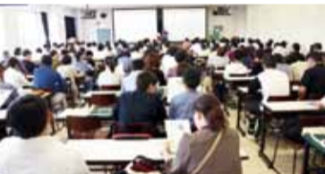
スタンプラリー説明の後、マナビ探検スタート