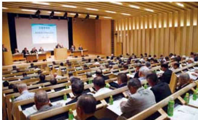
代議員210人が出席した通常総会

平成27年度校友会通常総会が5月22日、世田谷キャンパスの東京農大アカデミアセンター横井講堂で開かれた。全国から代議員210人(委任状49人)が出席した。平成26年度事業報告・決算、平成27年度事業計画・予算などが全会一致で承認された。