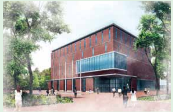
国際センター外観イメージ

校友各位には、経済状況が芳しくないなかで恐縮ですが、ご賛同いただき、同封しております払込票などでご支援を賜りますようお願い申し上げます。