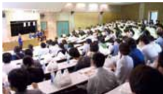
昼食は地元食材満載のオリジナルランチボックス

から、「オホーツクベール」の「学科ナビ体験」はツアertypeからスタンブラー型、「学部ナビ探検」へと進化し、受験生自ら各学科のチェックポイントを探しながら4学科を体験する内容となった。