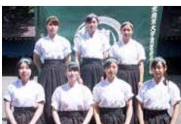
ベスト8に進出した部員

第45回全関東学生弓道選手権大会(6月20～21日、日本武道館) ▽女子団体Ⅱベスト8に進出