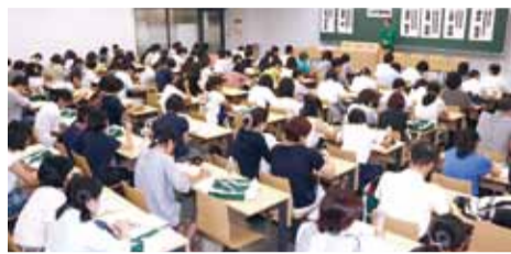
大勢の受験生が参加した入試対策講座