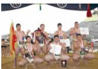
団体戦で優勝。個人戦でも3位入賞を果たした選手たち