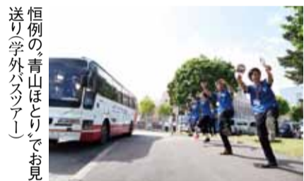
恒例の青山ほとりでお見送り(学外バスツアー)

昼食会場では、在学生トークライブを聴きながら、「オホーツクベール」の「学科ナビ体験」はツアertypeからスタンブラー型、「学部ナビ探検」へと進化し、受験生自ら各学科のチェックポイントを探しながら4学科を体験する内容となった。